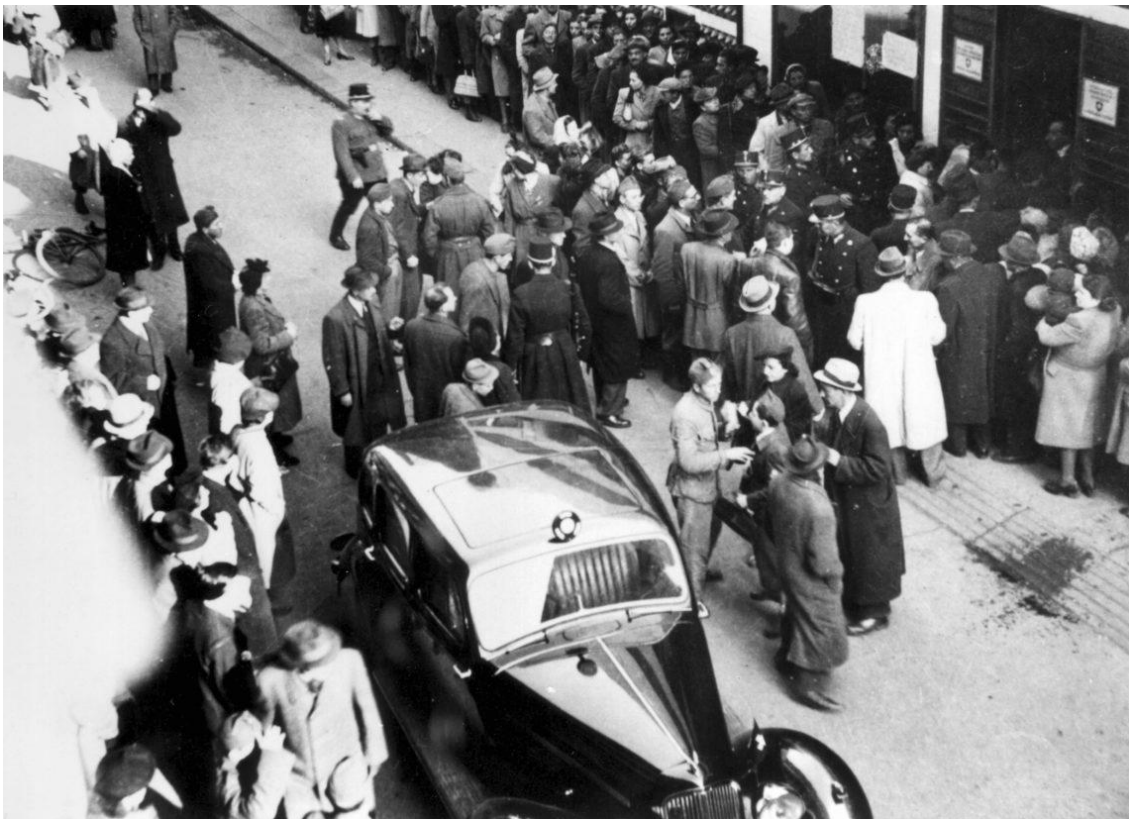
Svájci oltalomlevélre váró emberek a Vadász utcában 1944 őszén

A nemzetközi (védett) gettó a Terézvárosban is a semleges követségek által védett házakat jelentette. Ezek övezetét a pesti Duna-parton, a Pozsonyi út, Szent István körút és Szent István park kijelölt házaiban szervezték meg, de a védettség a gyakorlatban (egy-két rendőrposzt) alig jelentett valódi oltalmat. A nyilaskeresztes fegyveresek is tisztában voltak ezzel. Számukra kiváló célpontot nyújtottak e házak lakói, különösen azért, mert az ezekben menedéket keresőket tehetősebbeknek vélték, ami magában hordozta a gátlástalan zsákmányszerzés lehetőségét. A nyilasok 1944 novemberének végétől megkezdték az e házakban élő zsidók kifosztását, illetve meggyilkolását. A Duna partján a megalázott embereket a vízbe lőtték, de számos más helyen is folytak gátlástalan vérengzések: pártházakban, utcákon, tereken, kórházakban, lakásokban.