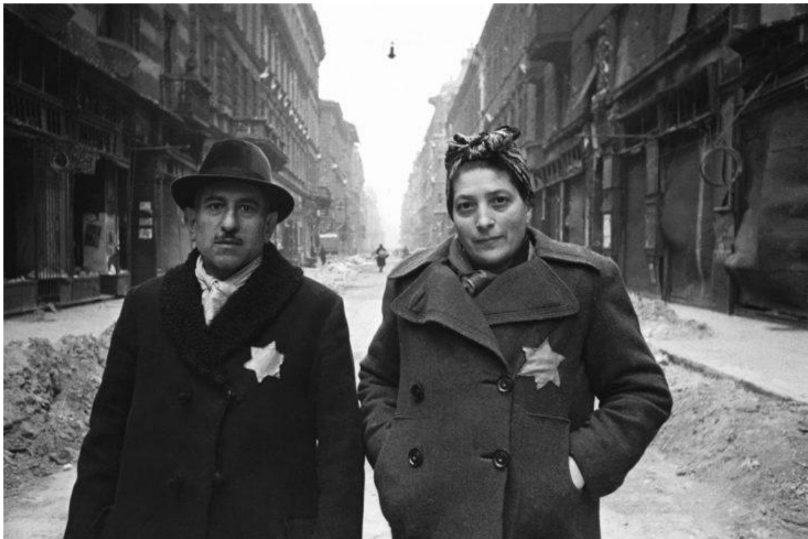
Sárga csillagot viselők a Ráday utcában 1945 januárjában, a felszabadulás napjaiban

valóságos voltát még inkább érzékelteti. Másképp hat az egykori események megidézése, ha nem általánosságban beszélünk róla, hanem megmutatjuk, hogy konkrétan ennek és ennek a háznak a lakóját hurcolták el, ezen az úton terelték őket ismeretlen sorsuk felé, ezen az állomáson szálltak fel a vonatra, itt vették el az életüket erőszakos és méltatlan módon. A lokálpatriotizmus és a helytörténet korszerű, nem idealizáló ismerete képes arra, hogy a történelmet más megvilágításba helyezze. Éppen ezért lehetőség szerint élni kell az ebben rejlő, jórészt talán még kiaknázatlan lehetőségekkel.