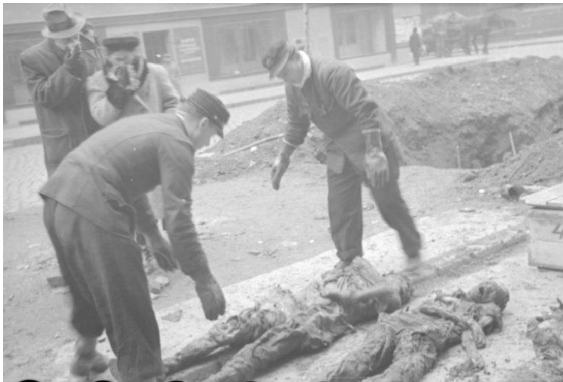
Exhumálás a Liszt Ferenc téren 1946 márciusában

szóhasználat („a zsidók”), helyette egy-egy személy történetét, normális, hétköznapi életét (családját, lakóhelyét, munkáját stb.), és e normális élet tragikus törését lehet bemutatni e megközelítéssel. A személytelen történetek szereplői ilyenén módon visszakapják személyiségüket, az áldozatoknak „újra” nevük, arcuk, egyéni sorsuk lesz. Márpedig, ahogy fentebb is esett róla szó, egy-egy konkrét személlyel, akinek ismerjük külsejét, szokásait, könnyebb azonosulni, egyszerűbb megérteni az áldozatok kiszolgáltatottságát, sorsukat az egyéni fájdalom bemutatásán keresztül: „áldozatok százezreiről, millióiról írni ijesztően »könnyű«, miközben a gyilkosságokat néhány mondat absztrakcióvá, személytelen adattá változtatja. Meg kell értetni [...] hogy egyedi és megismételhetetlen életek találkoztak a holokauszt eseményei során, hogy hozzájuk és a környezetükben élőkhez hasonló emberek találták magukat egyszer csak abban a helyzetben, hogy meg akarták őket ölni”. Mindezt a művészet eszközeivel nagyon nehéz ábrázolni, de lehetőség szerint ezt is fontos szempontnak tartom.