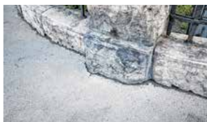
Az új tisztítószert egy használat után így eltünteti a kutyapiszkot