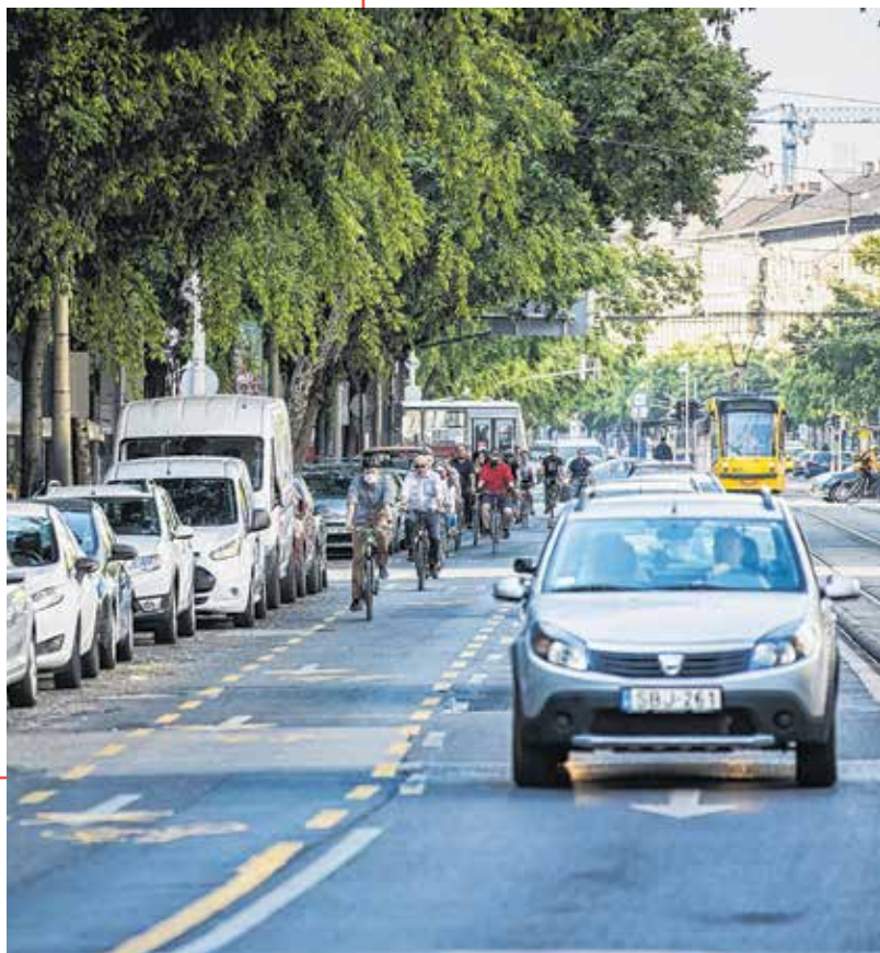
A híroldalakat összeállította: Dobi Ágnes és Gajdács Emese

Az október 4-én záruló pályázatra beérkezett javaslatok közül a szakmai zsűri által kiválasztott és díjazott ötleteket beépítik a fejlesztési programba is. A zsűri által kiemelkedően színvonalas vagy innovatív ötletek pénzdíjban részesülnek, összesen 700 ezer forint értékben.