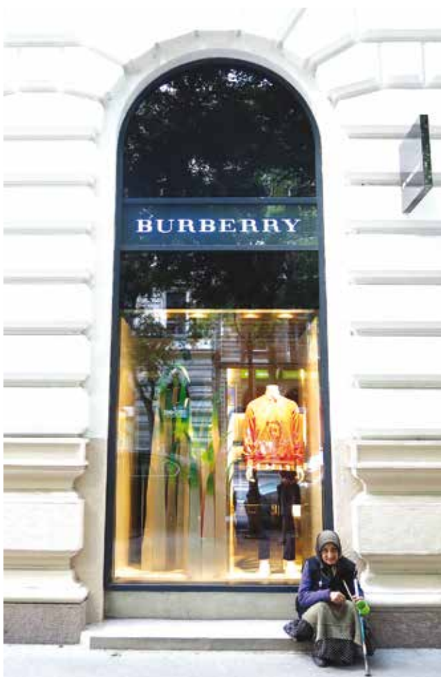
Gulyás Ede Kontraszt című képe.

A pályázat havi nyertese vásárlási utalványt kap, amelyet postai úton juttatunk el neki.