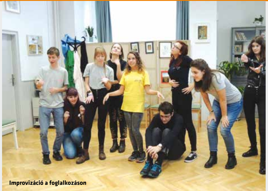
Improvizáció a foglalkozáson