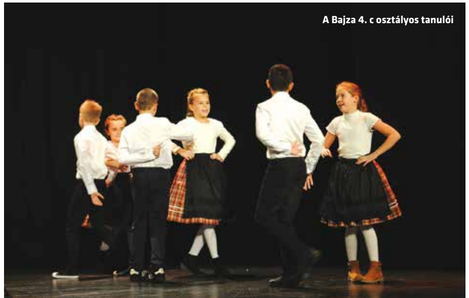
A Bajza 4. c osztályos tanulói

Miyazaki Jun beszédében hangsúlyozta, annak ellenére, hogy ezer éve, Szent István óta sokszínű nemzetként éljük mindennapjainkat, az országban jelenlévő 13 nemzetiségnek mégis olykor komoly küzdelmeket kell vívnia az elfogadásért, az érvényesülésért, az elismerésért. Az alpolgármester hangsúlyozta, a nemzetiségek hagyományainak, kultúrájának megismerése hozzájárul ahhoz, hogy a többségi társadalom megtanulja félretenni az előítéleteket és felismerje azt, hogy hazánk színes, gazdag kultúrája csak a nemzetiségek sokszínűségével teljes. Mint fogalmazott: Terézváros befogadó kerület. Ezt jelzi az is, hogy a Magyarországon lévő 13 nemzetiségből ebben a kerületben 10 önkormányzatot hozott létre. Az alpolgármester szólt a kerületben folyó nemzetiségi oktatásról is, az óvodák, iskolák a nyelvoktatás mellett segítenek abban is, hogy a gyerekek már kis-