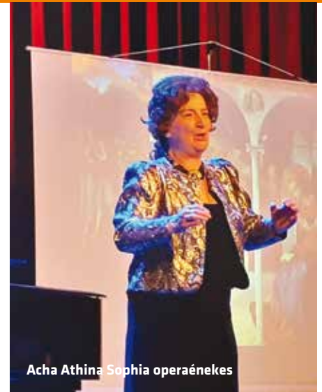
Acha Athina Sophia operaénekes

1810-ben, november 7-én született meg egy gyulai tanító fiaként Erkel Ferenc. A nemzeti romantikus opera megteremtőjének születésnapja 2013 óta a magyar opera