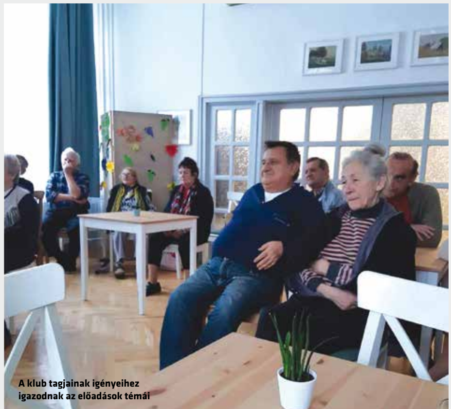
A klub tagjainak igényeihez igazodnak az előadások témái

Legközelebb a nagy korallzátóy élővilágát és a kengurut mutatják be a Zöld urai – Élő környezetünk előadás-sorozat keretében.