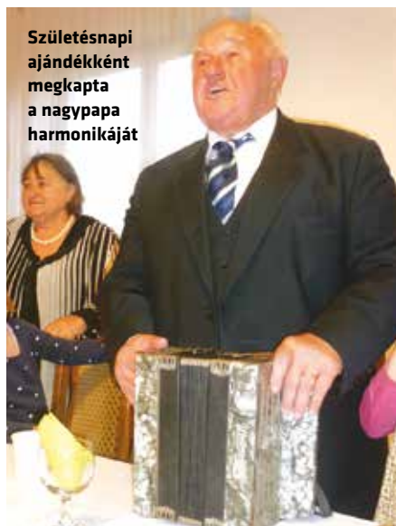
Születésnap ajándékként megkapta a nagypapa harmonikáját

- Ön olyan jelenség, aki ha megjelenik a színpadon és egy szót sem szól, már nevet a közönség.