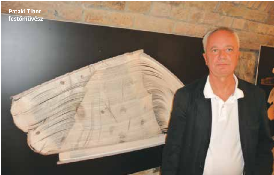
Pataki Tibor festőművész