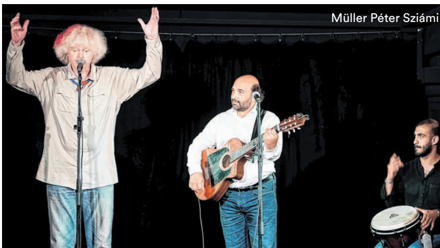
Müller Péter Sziámi