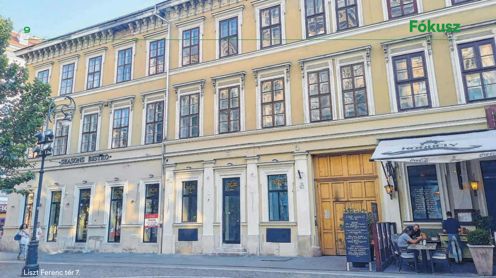
Liszt Ferenc tér 7.

A végeláthatatlan, egyre több szálon futó ingatlanbotrányba a jelenlegi perújítási eljárás mellett Fürst György összevont ügyei, a Jókai utca 10. szám alatti épület homályos eladási kísérlete miatt a Pesti Központi Kerületi Bíróságon indult bünyügi, illetve egy az értékbecslők ellen irányuló eljárás tartozik.