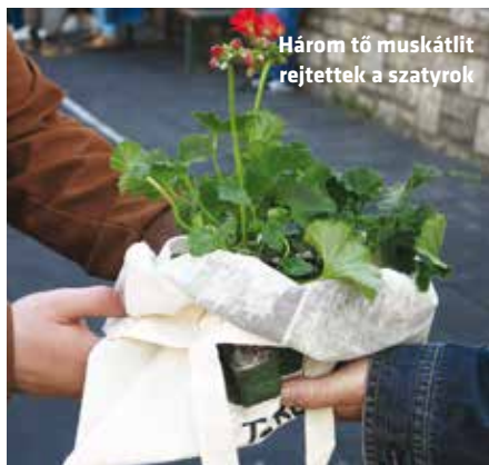
Három tő muskátlit rejtettek a szatyrok

Környezettudatos gondolkodásukról tettek tanúbizonyságot azok a terézvárosiak, iskolai és óvodai csoportok, akik nem érkeztek üres kézzel, hanem magukkal hozták az év közben otthonukban, intézményükben felgyűlt veszélyes hulladékot. A Hunyadi tér melletti gyűjtőponton szétválogatva külön tartályokba kerültek az elemek, a festékek és oldószerek, a fáradt olaj, az izzók és fénycsövek, a leselejtezett irodai számítástechnikai