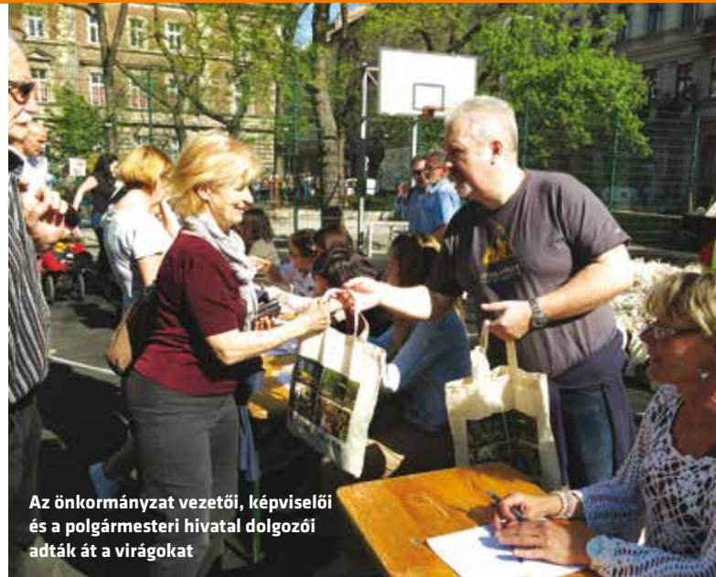
Az önkormányzat vezetői, képviselői és a polgármesteri hivatal dolgozói adták át a virágokat