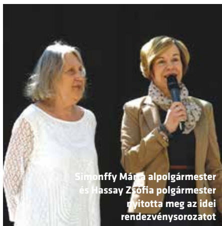
Simonffy Márta alpolgármester és Hassay Zsófia polgármester nyitotta meg az idej rendezvényt

A szórakoztatásról ezúttal Levente Péter előadóművész gondoskodott. A gyerekek kedvence ezúttal is elvarázsolta a kicsiket és talán azokat a felnőtteket is, akik évtizedekkel ezelőtt az általa vezetett Zsebtévé című műsoron nőttek fel.