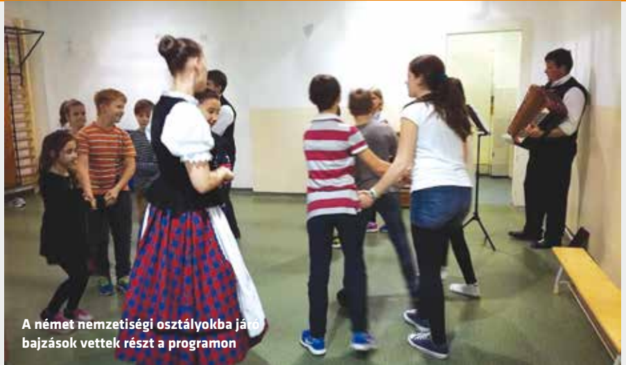
A német nemzetiségi osztályokba járó bajzások vettek részt a programon

- Első pillanattól kezdve nagy hangsúlyt fektettem arra, hogy az állományom tagjai munkájukat hivatástudattal, szakszerűen és speciális szolgáltatásként végezzék. Ez utóbbit a magam részéről minőségi követelménynek tartom, úgy gondolom, hogy a rendőrnek azt a többletjogosítványt, amit a törvény biztosít számára, nem a hatalmi pozíciójának erősítésére, hanem a közjó érdekében kell használnia. A lakosság részéről velünk szemben megnyilvánuló bizalomból arra következtek, hogy ezt sikerült megvalósítani. Rendőrnek lenni nem egy 8-16 óráig tartó foglalatosság, hanem egy sok lemondást igénylő, kemény munkával járó hivatás. A sok fiatal, agilis, jól képzett rendőrből álló kapitányság számos olyan eredményt tud felmutatni, amelyek céljaim között szerepeltek, de a saját bizonyítványom kiállítását inkább feletteseimre és a Terézvárosban élőkre bízom.