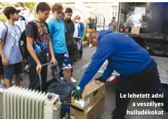
Le lehetett adni a veszélyes hulladékokat

A Föld napját április 22-én tartjuk. 1970-ben Denis Hayes amerikai egyetemista indította el a mozgalmat a Föld védelmére az a céllal, hogy a környezet, a természet sebezhetőségére, értékeinek védelmében minden ember személyes felelősségére hívja fel a figyelmet. A 175 ország részvételével világméretűvé vált eseményt Magyarországon 28. alkalommal tartották meg. A szavazás alapján a Föld napjának 2018-as kiemelt témája a műanyagmentes világ lett, legfőbb üzenete: „Tájékozódj, élj műanyagok nélkül, tégy a túlfogyasztás, az éghajlatváltozás ellen! Minden héten!”