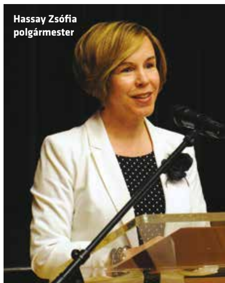
Hassay Zsófia polgármester

Az önkormányzat és a rendvédelmi szervek kapcsolatáról szólva elmondta, bár a kerület nem nagy, néha mégis azt lehet érezni, hogy minden itt történik. „Gondoljunk, csak a nagyobb fel-