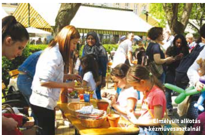
Élmélyült alkotás a kézművesasztalnál