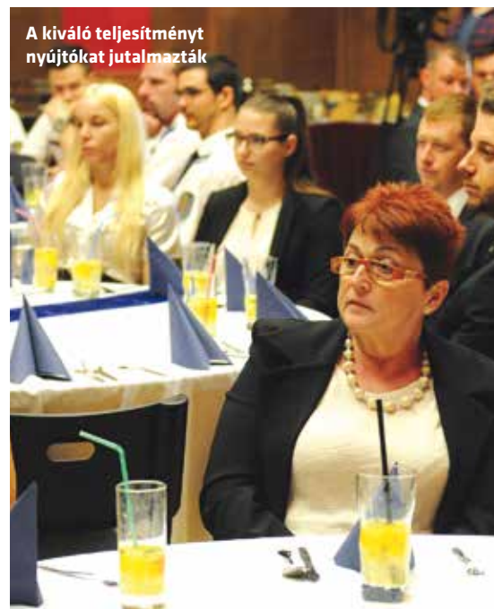
A kiváló teljesítményt nyújtókat jutalmazták

vonulásokra, amelyek rendre az Októbertől indulnak, s a tömegek gyakran