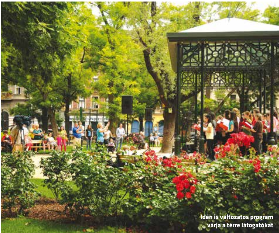
Idén is változatos program várja a tere látogatókat

Nagy szeretettel vár az önkormányzat mindenkit szombatonként a Hunyadi tere – mondta az alpolgármester, s ígérte szerint, aki elfogadja az invitálást, annak nagyszerű programokban lesz része.