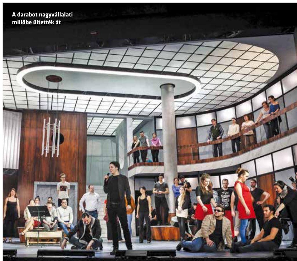
A darabot nagyvállalati milióba ültették át