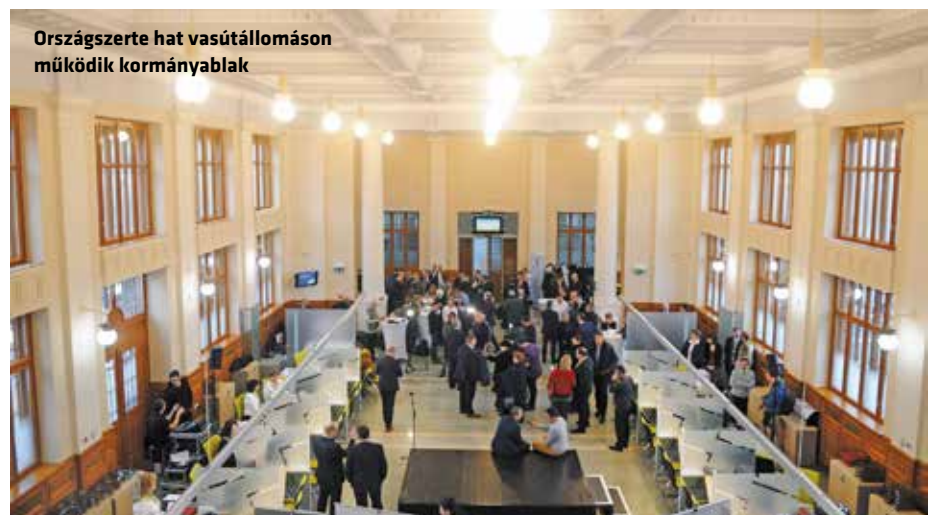
Országszerte hat vasútállomáson működik kormányablak

Kiért arra is, hogy a MÁV integrált állomás- és ügyfélszolgálat-fejlesztési programja keretében országszerte már hat vasútállomáson működik kormányablak és további hét megnyitását tervezik, köztük március 31-én a már említett a budapesti Keleti pályaudvaron.