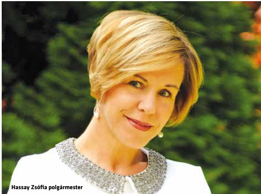
Hassay Zsófia polgármester

Az önkormányzat a kerület megújítását és az itt élők életminőségének javítását jelentő terveket tudja valóra váltani, és ennek nyertesei a terézvárosiak – mondta lapunknak Hassay Zsófia polgármester.