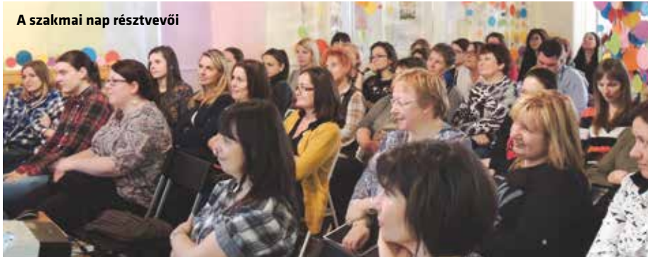
A szakmai nap résztvevői

Szakmai napot tartottak a terézvárosi óvodapedagógusok. A február 12-én a Játékvár Óvodában megrendezett egész napos eseményen olyan fontos kérdések és jelenségek kerültek napirendre, amelyekkel munkájuk során nap mint nap találkoznak az intézmények dolgozói.