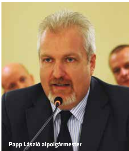
Papp László alpolgármester

Papp László szavai szerint a Terézvárosi Egészségügyi Szolgálat épületében tavaly megkezdett, az idén folytatódó felújítás lényegében megalapozza a szakrendelő későbbi teljes arculati megújulását. A vizesblokkok, a gépészeti, az energetikai, az elektromos rendszer korszerűsítését követően válik tervezhetővé a gyógyító munka feltételeit, a betegek kényel-