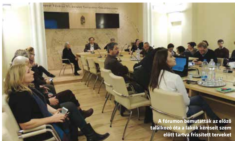
A fórumon bemutatták az előző találkozó óta a lakók kéréseit szem előtt tartva frissített tervek

Az alpolgármester elmondta, az önkormányzat elfogadta a lakók javaslatát, hogy a