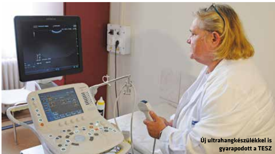
Új ultrahangkészülékkel is gyarapodott a TESZ

Az alpolgármester mintegy zárszóként úgy fogalmazott, bízik benne, hogy a fejlesztések kapcsán az ellátórendszer színvonalában megmutatkozik majd, hogy az önkormányzat a kerületben élők egészségét kiemelten fontos értéknek tartja.