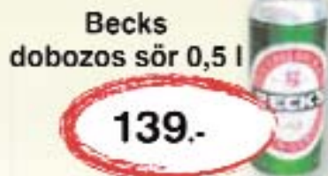
Becks dobozos sör 0,5 l