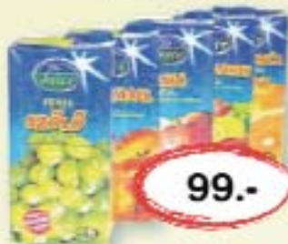
Dr. Juice üditők 1 l