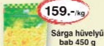
Sárga hüveljű bab 450 g