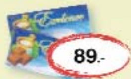
Exelence tejszoki 100 g