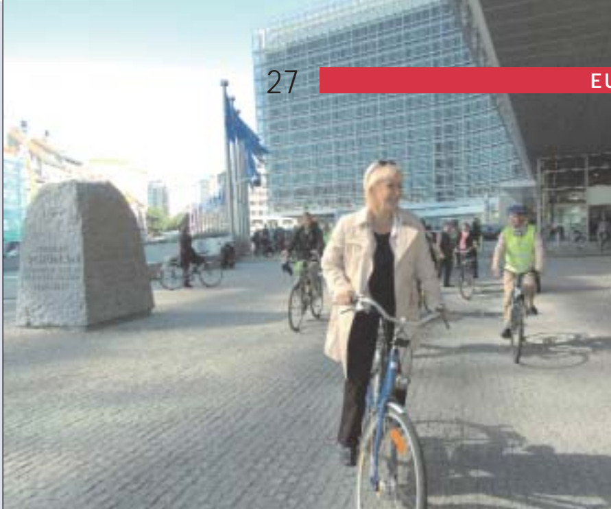
Az Európai Bizottság szerint itt az ideje egy, a városi közlekedésre összpontosító stratégiának

Az Új Magyarország Fejlesztési Terv első turisztikai pályázata október 4-én jelenik meg: 58 milliárd van az egészség-, öko-, bor- és kulturális turizmus vonzerejének növelésére, ez kb. 250 nonprofit szervezet és önkormányzatok beruházására lehet elég. Például strandok és fürdők felújítása, országos és nemzetközi rendezvények szervezése szerepel várhatóan a projektek között. A szálláshely-fejlesztési csomag november elején jelenik meg, erre gazdasági társaságok is nevezhetnek, 26 milliárd forintot osztanak ki mintegy 130 beruházásra.