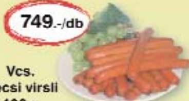
Vcs. Bécsi virsli 400 g