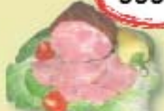
Füstölt főtt tarja