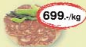
Mágnás disznósajt vf.