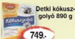
Detki kókusz- golyó 890 g