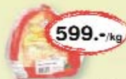
Fagyos libacomb részek