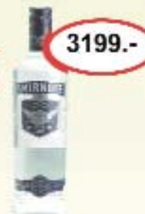
Smirnoff 0,7l vodka