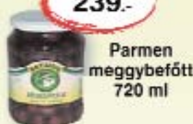
Parmen meggybefőtt 720 ml