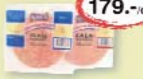
Mindennap finom Olasz, Zala felvágott 150 g