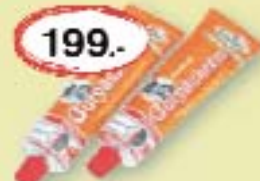
Gulyáskrém csemege 180 g