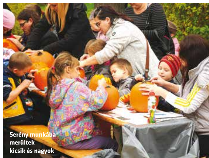
Serény munkába merültek kicsik és nagyok