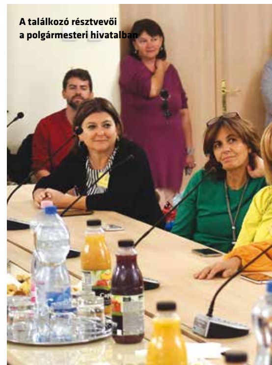
A találkozó résztvevői a polgármesteri hivatalban

A külföldről érkező pedagógusok az itt töltött időben a magyar fővárossal is megismerkedhettek, s noha az eltöltött néhány nap nagyon rövid volt, sok kellemes és élményekkel teli pillanatot éltek át a találkozó résztvevői.