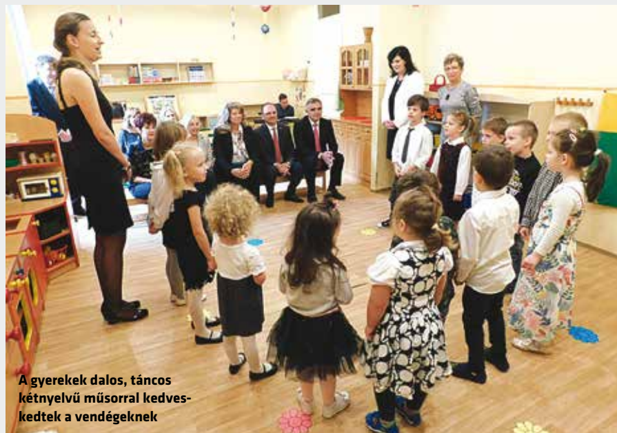
A gyerekek dalos, táncos kétnyelvű műsorral kedveskedtek a vendégeknek

merően szólt arról a munkáról, amit az óvoda pedagógusai végeznek, valamint köszönetet mondott Simonffy Mártának azért a segítségért, amit Terézváros nyújt a kerületben működő bolgár intézményeknek. Az alpolgármester üdvözöl-