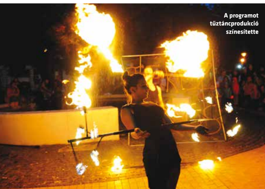
A programot tűztáncprodukció színesítette