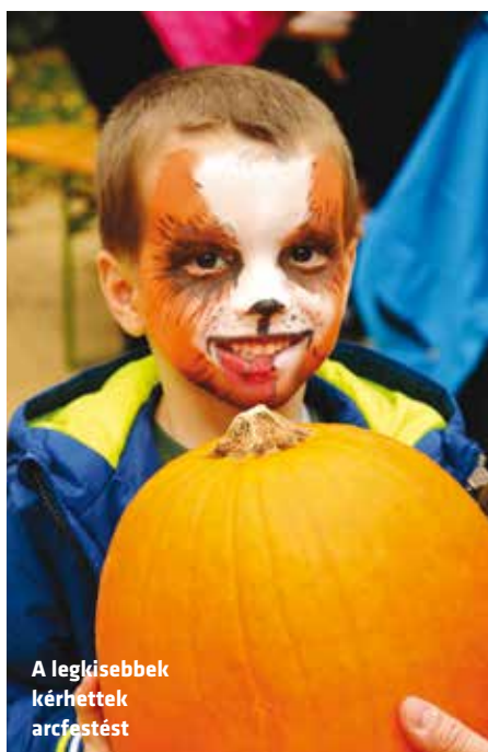
A legkisebbek kérhettek arcfestést