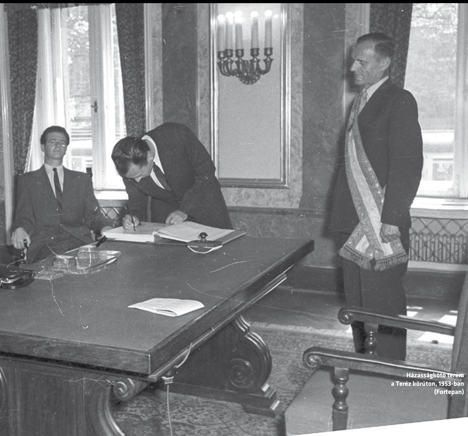
Házasságkötő terem a Teréz körúton, 1953-ban