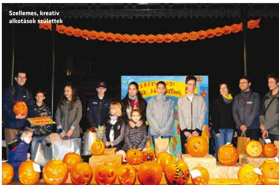
Szellemes, kreatív alkotások születtek